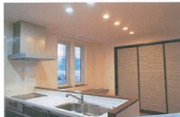
開放感いっぱいのオープンキッチン