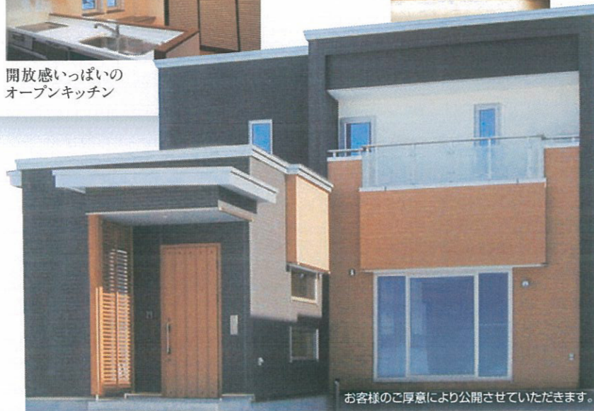
お客様のご厚意により公開させていただきます。